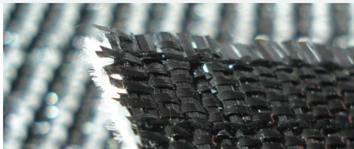
Geoter® FPET 400/50