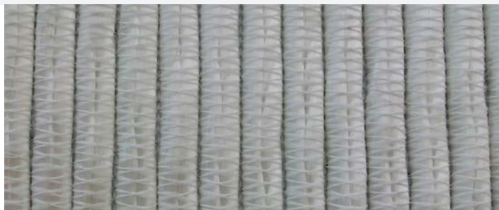
Geoter® FPET 1350/135